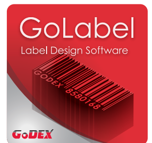
附赠标签编辑软件GoLabel 轻松制作及打印条码标签