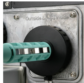
碳带内外卷自动切换设计 安装方便、使用简单